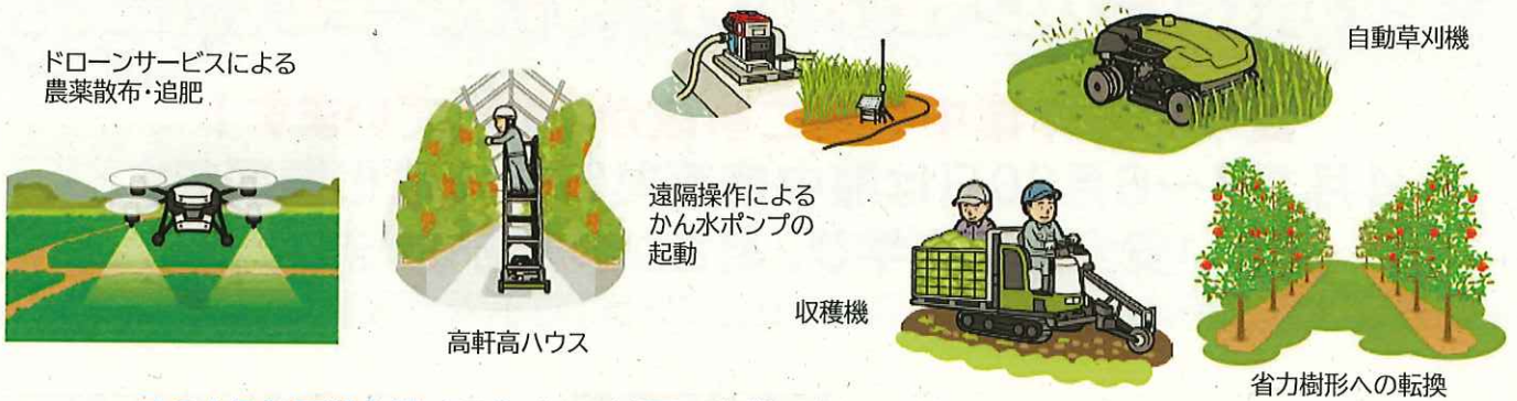
ドローンサービスによる 農薬散布・追肥

熱中症等の夏の農作業事故リスクを低減するためには農作業を省力化・軽労化することが有効です。スマート農業技術や農業サービス事業者の活用等を検討しましょう。