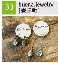
14Kゴールドフィードと天然石のアクセサリ