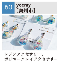
レジンアクセサリ、ポリマークレイアクセサリ