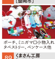
ポーチ、ミニガム口小物入れ、タバストリ、ペンケース他