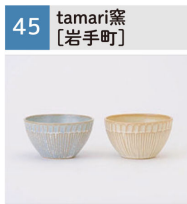
マグカップ、茶碗、皿等