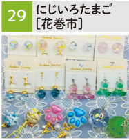
レジンキーホルダー、置物、サンキャッチャー他