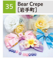
キッズヘアアクセサリ、布小物、靴