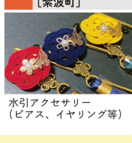
水引アクセサリ(ピアス、イヤリング等)