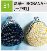
ガマ口、パネ口、ポーチ、手編みくつ下、バッグ