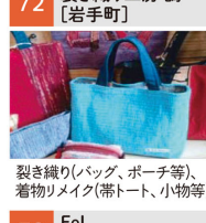
裂き織り(バッグ、ポーチ等)、着物メイク(帯トート、小物等)