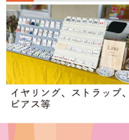
イヤリング、ストラップ、ピアス等