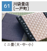
ミニ畳(大・中・小)