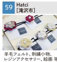
羊毛フェルト、刺繍小物、レジンアクセサリ、絵画等