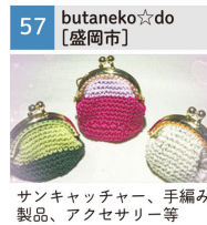
サンキャッチャー、手編み製品、アクセサリ等