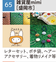
レターセット、ポチ袋、ヘアアクセサリ、着物メイク等