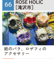
紙のバラ、ロザフィのアクセサリ