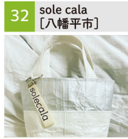
牛乳パックのアップサイクルバッグ