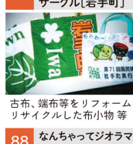
古布、端布等をリフォーム、リサイクルした布小物等