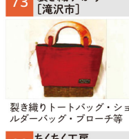
裂き織りトートバッグ・ショルダーバッグ・フローチ等