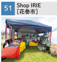
布雑貨、レザークラフト、パラコード雑貨