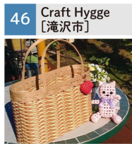
紙バンドやPPバンドの雑貨、アクセサリ等