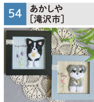
手刺繍のバッグ、小物、アクセサリ等