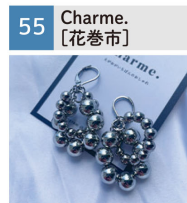
イヤリング、ネックレス、ブレスレット