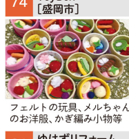
フェルトの玩具、メルちゃんのお洋服、かぎ編み小物等