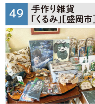
布雑貨(財布、ポーチ、かばん等)、くろみ細工、絵はがき