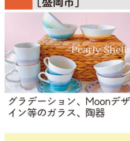
グラデーション、Moonデザイン等のガラス、陶器