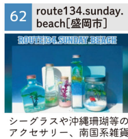
シーグラスや沖縄珊瑚等のアクセサリ、南国系雑貨