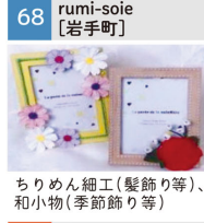
ちりめん細工(髪飾り等)、和小物(季節飾り等)