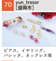
ピアス、イヤリング、パレット、ネックレス等