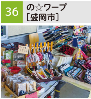
蛇腹のカードケース、巾着、鍋つかみ、コインケース他