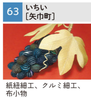
紙紐細工、クルミ細工、布小物