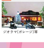
ジオラマ(ガレージ)等