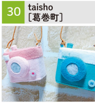
フェルトままごと、フェルトのおもちゃ