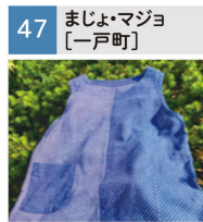
古布、ゆかた、リメイク服、小物