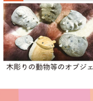
木彫りの動物等のオブジェ