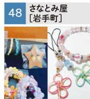
天然石ストラップ、水引小物、アクセサリ他