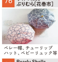
ベレー帽、チューリップハット、ベビーリュック等