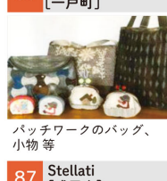
パッチワークのバッグ、小物等