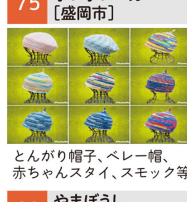
とんがり帽子、ベレー帽、赤ちゃんスタイ、スモック等