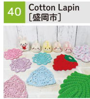
かぎ針編み小物、布小物、羊毛フェルト等