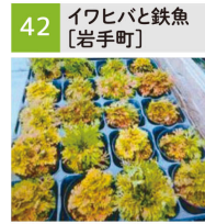
イワヒバ(鑑賞用植物)、鉄魚、金魚