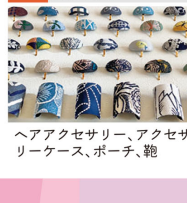
ヘアアクセサリ、アクセサリケース、ポーチ、靴