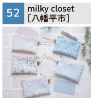
リパティ布小物、ドライフラワーアレンジメント