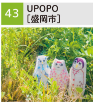
アイヌ文様刺繍作品(服、アクセサリ、カバン等)