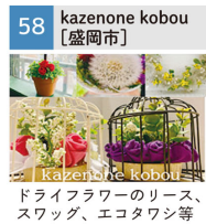
ドライフラワーのリース、スワッグ、エコタワシ等