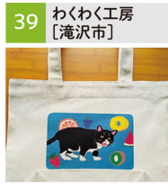
プリントトートバッグ、エコバッグ、アクセサリ等