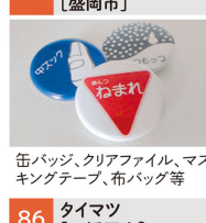
缶バッジ、クリアファイル、マスクングテープ、布バッグ等