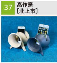
陶器製スピーカー、食器