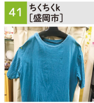
チュニック、パンツ、エプロン