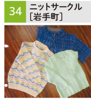
セーター、カーディガン、帽子、ベスト、靴下カバー等