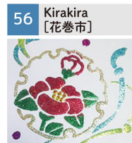
開運ラメアート、デコレーション各種、ワークショップ等