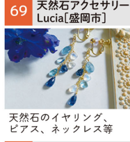
天然石のイヤリング、ピアス、ネックレス等