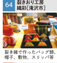
裂き織で作ったバッグ類、帽子、敷物、スリッパ等