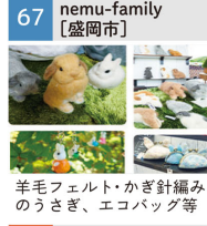
羊毛フェルト・かぎ針編みのうさぎ、エコバッグ等