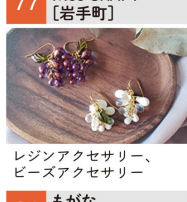
レジンアクセサリ、ピアスアクセサリ