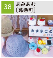
毛糸のおまごとキット、手編み帽子、ベスト他