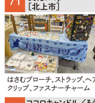
はさむフローチ、ストラップ、ヘアクリップ、ファスナーチャーム