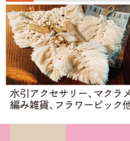
水引アクセサリ、マクラメ編み雑貨、フラワーピック他