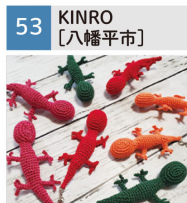
あみぐるみ、毛糸小物