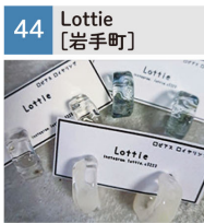
レジンアクセサリ