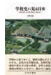
学校史に見る日本