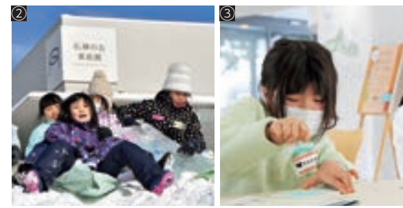
①花とアートの森 彫刻の前で記念撮影 ②肥料袋のソリ遊びを楽しむ子どもたち ③版画の絵ハガキ作成に夢中になる児童

石神の丘美術館では1月6日、町内の小学生を対象に、2年ぶりに「美術館で過ごす冬の1日」が開催されました。参加した子ども11人は企画ギャラリイで開催された「町小中学校・高校絵画コンクール」の作品を見学。銀世界に覆われた花とアートの森を探索し、カモシカやキツネなどの足跡を見つけました。その後、肥料袋を使ったソリ滑りや雪だるまづくりを体験。レ