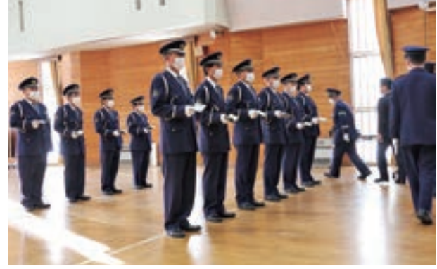
装備品の点検をする交通指導員