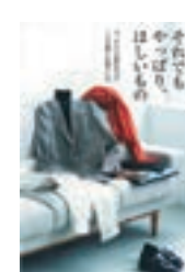
それでもやっぱり、ほしいもの