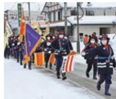
町婦人消防協力隊の規律揃った分列行進防災力強化には地域の連携が欠かせない