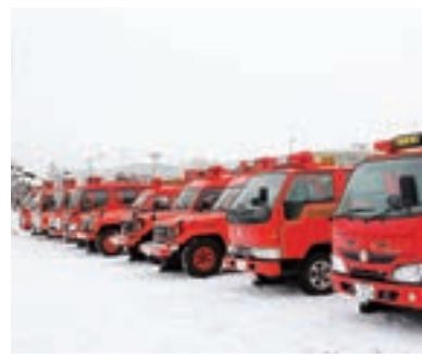
雪景色に映える一列に並んだ消防車両火災の発生場所へいち早く駆けつける