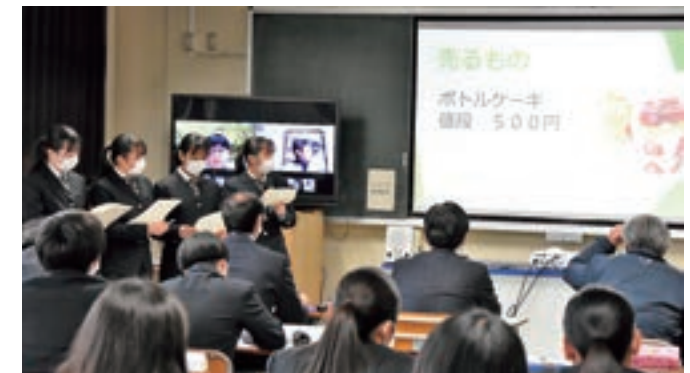
町の特産物を使ったスイーツの商品開発を提案する生徒