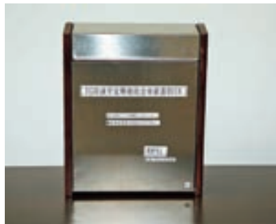
町内 I G R 駅にポストを設置しています