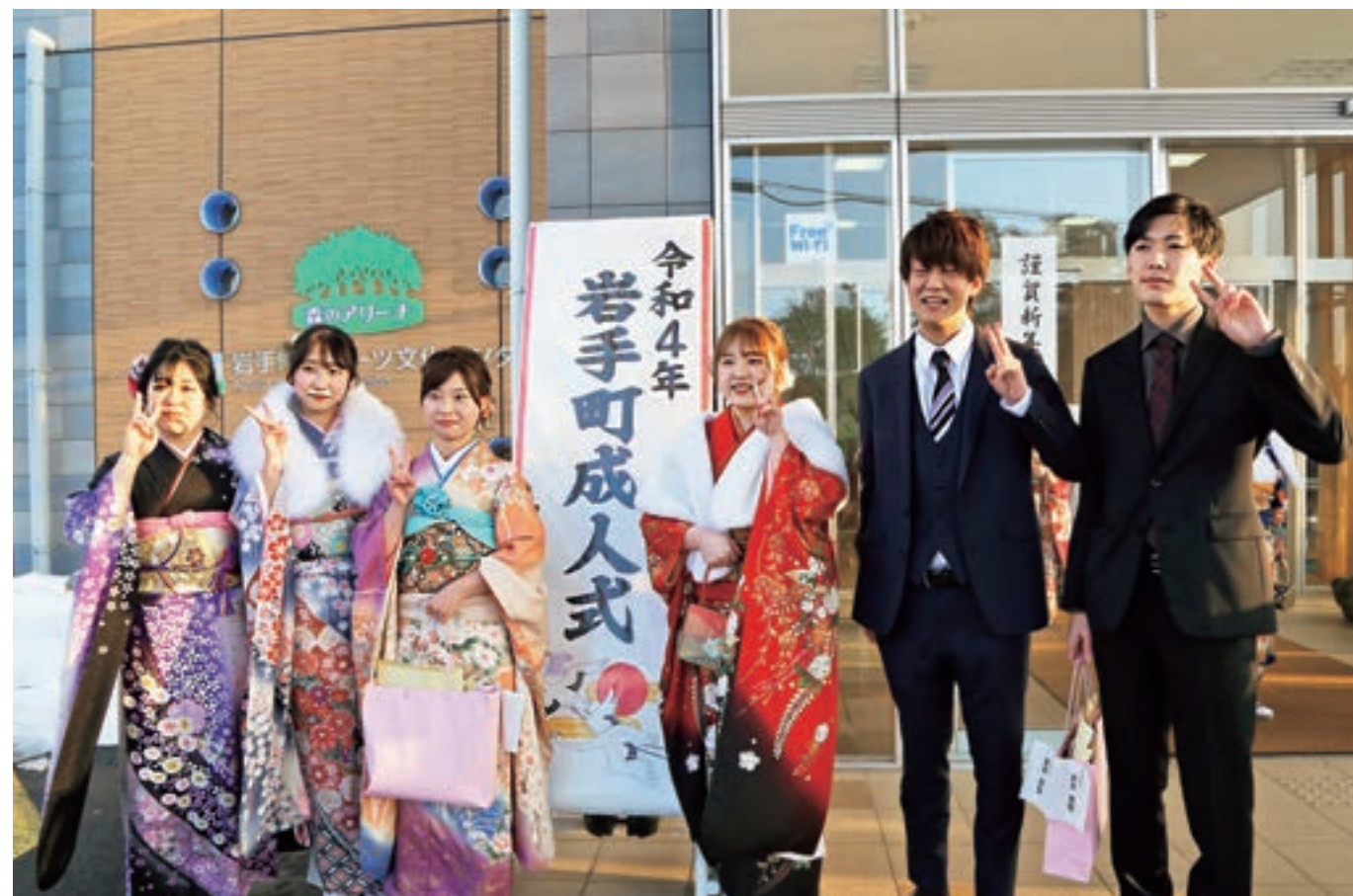
令和4年岩手町成人式