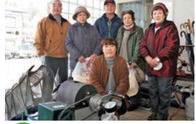
ドン菓子づくりに参加した皆さん