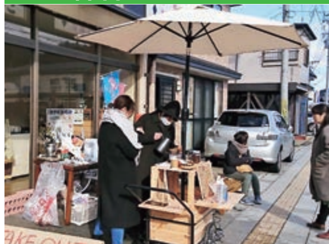
地元の商店と共同でコーヒーを販売する 地元木材で作られたコーヒースタンド