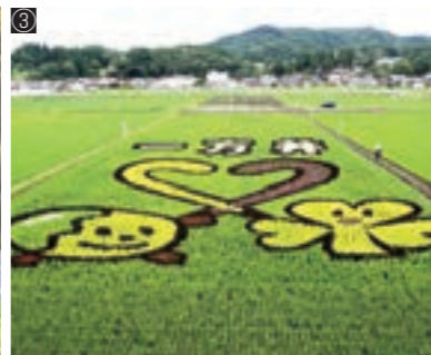
①町ホッケー場 ②御堂観音堂 ③一方井地区田んぼアートなど町の宝物スポットを巡るウォーキングコースを新設予定