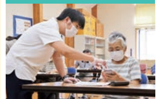
町はパソコンやスマートフォン教室を開催し利用者の利便性を図っています