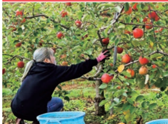
町の農業の取り組みに関心がある明治大生が農家でりんごの収穫を体験