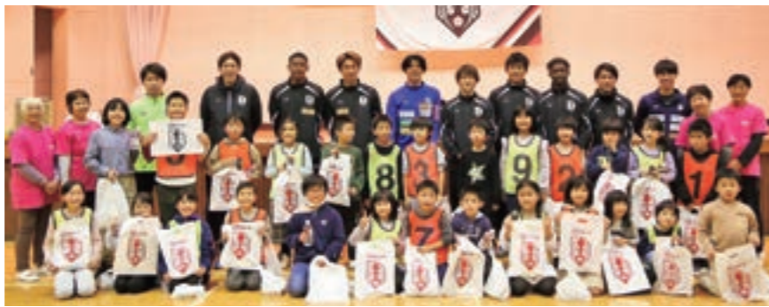
多世代交流型子ども食堂モデル構築プロジェクトに参加した皆さん。誰もが気軽に参加できるスポーツを通じた地域交流の場を構築する