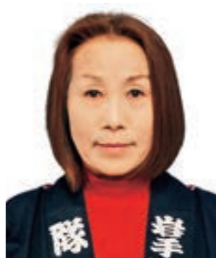
町婦人消防協力隊 (写真：黒沢真里子隊長)

火災や災害はいつ発生するか分かりません。防災意識を日頃から皆さんに持ってもらう、有事のときに皆さんと協力して行動できる人を地域から育てられるよう活動に取り組みます。