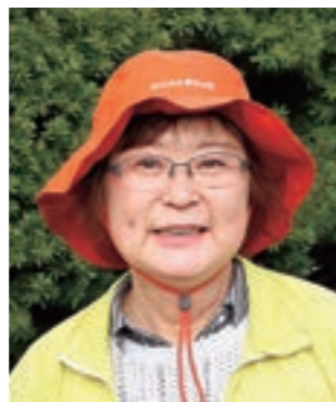
町商工会女性部 (写真：藤原淳子会長)

岩手警察署前の花壇整備や産業まつりで郷土料理の販売、ボランティア活動を行っています。町の商店も大変な状況ですが、皆さんで知恵と力を出し合って、地域を盛り上げていきたいです。