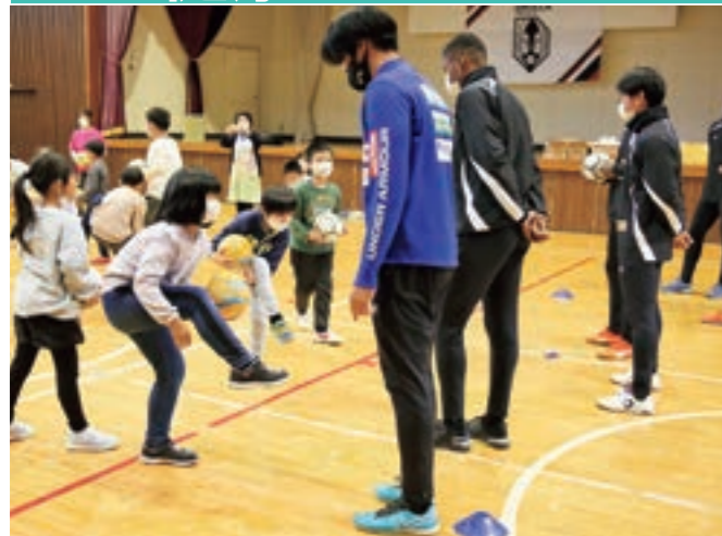
いわてグルージャ盛岡のサッカー選手と一緒に ボールに親しむ一方井学童クラブの子どもたち