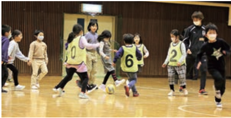
いわてグルージャ盛岡の選手と練習試合で交流する子どもたち。プロの選手から指導を受けて身体を動かすことの楽しさを体験

活環境の整備を探っています。令和3年度は、健康で持続的な生活環境をつくる取り組み「地域の特徴・資源を生かした多世代交流型の子ども食堂モデルの構築」と「岩手町まるごと健康フィールドプロジェクト」の2つを進めています。健康づくりとコミュニティづくりの推進に向けて知恵を出し合いながら、町を元気に楽しくする活動を行っています。