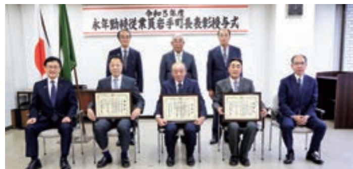
35年以上の長きにわたり町内企業に勤続し町の商工業の発展を支えた受賞者と関係者の皆さん