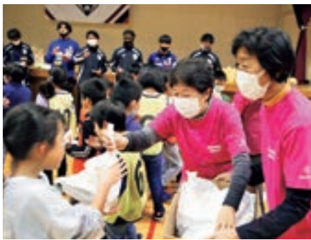
町食生活改善推進委員の皆さんが子どもたちに地域のおやつを配布

健康ラボの1つ「多世代交流型子ども食堂モデル構築プロジェクト」が昨年11月17日、一方井健康センターで行われました。一方井学童保育クラブの児童38人がいわてグルージャ盛岡の選手からサッカーの基本的技術を教わり、一緒に試合形式でプレーに参加。教室後は、町食生活改善推進委員の皆さんから、がんづきやみそそばなどのおやつが振る舞われ、世代間での交流を深めました。