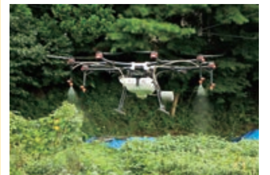
畑へ農業の飛行散布を行うドローン(一方井) 今後は「スマート農業」の進展が期待されます