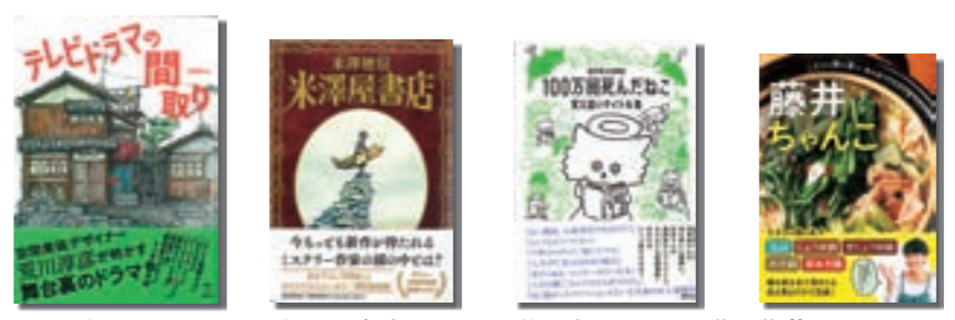
テレビドラマの関わり 米澤屋書店 覚え違いタイトル集 藤井ちゃんこ 100万回死んだ猫