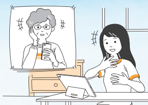
●家族や友人との会話