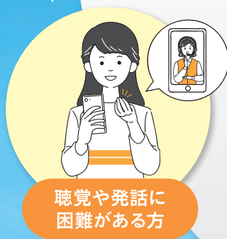
聴覚や発話に 困難がある方