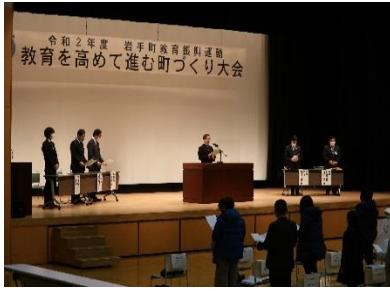
新型コロナウイルス感染症予防対策のため参加者全員で町民憲章を黙読