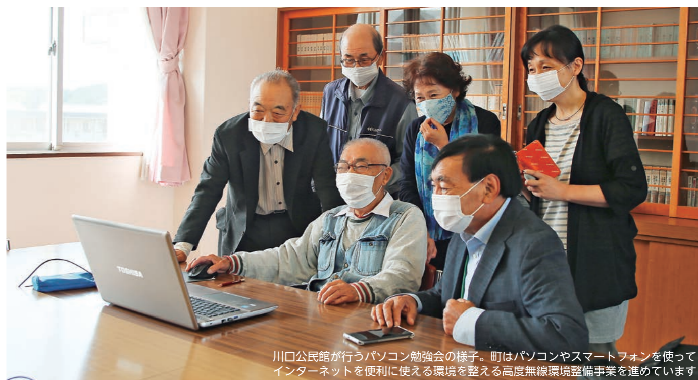
川口公民館が行うパソコン勉強会の様子。町はパソコンやスマートフォンを使ってインターネットを便利に使える環境を整える高度無線環境整備事業を進めています

【相談窓口】 ☎ 0120 - 116 - 116 (受付時間は午前9時～午後5時まで)