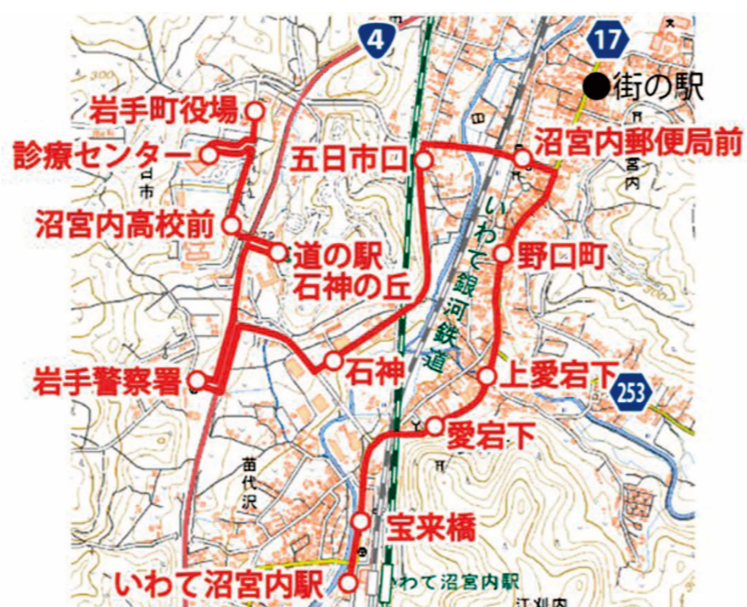
【まちなか循環線・あいあいバスまちなかエリア路線図】

あいあいバスと併せて、沼宮内地区のまちなかを循環する「まちなか循環線」の運行を開始しました。医療機関や商業施設、官公庁などの間の移動に利用ください。ルートは右図のとおりで、あいあいバスも同じ経路を運行します。運行概要は以下のとおり。