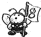
岩手県地球温暖化防止 県民運動キャラクター エコハッチちゃん

図書館などの公共施設やショッピングモール、温泉、スポーツ施設などの『ウォームシェアスポット』に出かけることで、地域の活性化にもつながります。